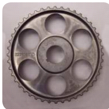
2. kép: OE #: 023 109 111 D

© Az SKF az SKF Csoport bejegyzett védjegye.