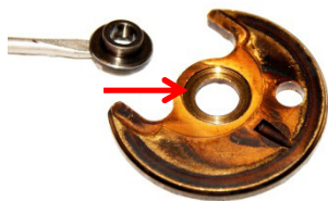
Durch Axialschub eingelaufene Anlaufscheibe