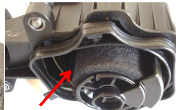
Ölnebelabscheider zugesetzt Wechselintervall neu 45.Tkm! (hier alte Ausführung)