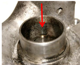
Ölnebeleintrag in das Verdichtergehäuse