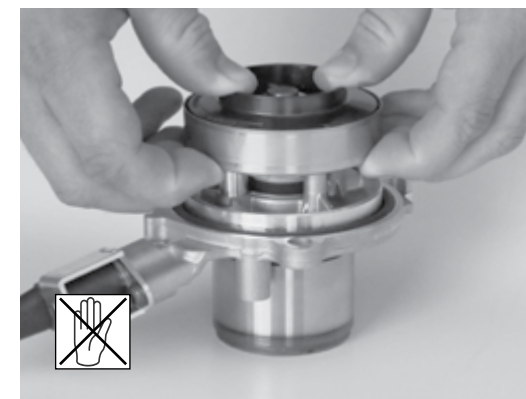
Abb. 2/ Fig. 2/ Puc. 2/ 图2