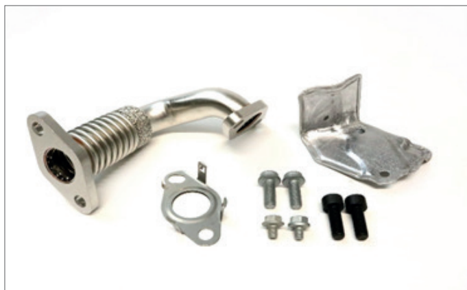
218999A = Automatikgetriebe