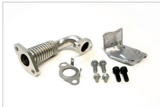
218999S = Schaltgetriebe