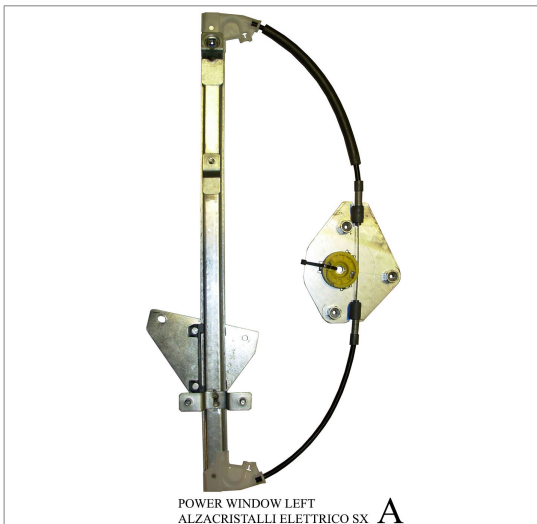
POWER WINDOW LEFT ALZACRISTALLI ELETTRICO SX A

THIS INSTALLATION INSTRUCTION IS FOR BOTH LEFT AND RIGHT SIDE. CETTE INSTRUCTION DE MONTAGE EST POUR LES DEUX COTES DROIT ET GAUCHE. DIESE MONTAGE-ANLEITUNG IST FÜR DIE BEIDE LINKE UND RECHTE SEITE. ESTA INSTRUCCION DE MONTAJE ES PARA LOS DOS LADOS IZQUIERDO Y DERECHO. ESTAS INSTRUÇÕES VALEM TANTO PARA O LADO ESQUERDO QUANTO PARA O DIREITO. DEZE AANWIJZINGEN GELDEN VOOR ZOWEL DE LINKER- ALS DE RECHTERKANT. Η ΠΑΡΟΥΣΑ ΟΔΗΓΙΑ ΑΦΟΡΑ ΤΟΣΟ ΤΗΝ ΑΡΙΣΤΕΡΗ ΟΣΟ ΚΑΙ ΤΗ ΔΕΞΙΑ ΠΛΕΥΡΑ. LA PRESENTE ISTRUZIONE VALE SIA PER IL LATO SINISTRO CHE PER IL LATO DESTRO.