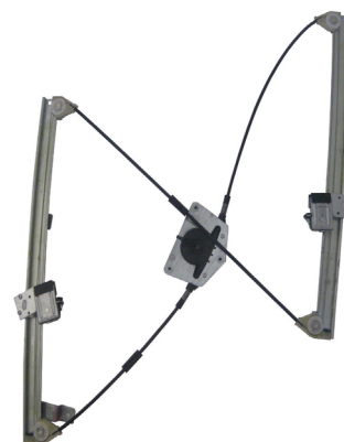
Our window regulator - notre lève-vitre - unser Fensterheber - nuestro elevalunas- nosso levantator de vidro - Γρύλος γνήσιος - nostro alzacrystallo