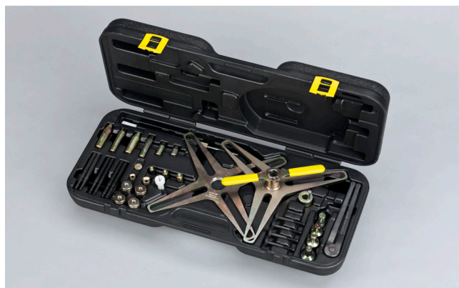
2. ábra: A 400 0237 10 cikkszámú célszerszám professzionális kuplungjavítást tesz lehetővé

A kuplungon végzett javítási és karbantartási műveleteknél a Schaeffler Automotive Aftermarket alapvetően a 400 0237 10 cikkszámú célszerszámot ajánlja. A szerszám használatáról útmutatásokat a www.repxpert.com honlapon találnak.