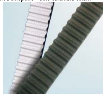
Рис 2: Черное и белое покрытие на зубчатых ремнях

Schaeffler Automotive Aftermarket не берет на себя риски, связанные с ремнем: ремни ГРМ в многочисленных комплектах удовлетворяют требованиям ОЕ без исключений.