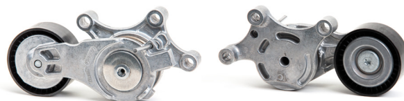
2 pav.: Nauja konstrukcija

Kadangi stengiamės nuolat tobulinti savo gaminius, modifikavome diržo įtempiklį, kurio dalies numeris yra 534 0075 20.