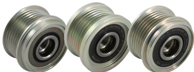
2. ábra: Generátor szabadonfutók 535 0063 10 (balra), 535 0202 10 (középen), 535 0203 10 (jobbra)

A fent megnevezett merev generátor-szíjtárcsás járműveknél a vibráció és zavaró hangok jöhetnek a segédberendezések hajtásából. Ezek a benzinmotorokkal összehasonlítva a dízelmotorok nagyon egyenlőtlen járásából adódnak.