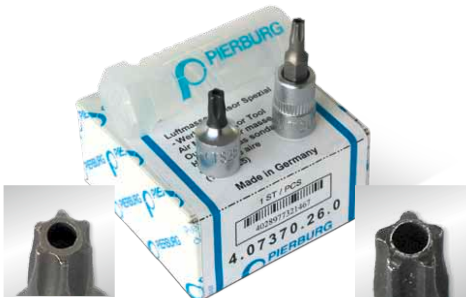
Вставка T 20 (6-лучевая, Torx®) с торцовым отверстием

Замена серийно установленных датчиков массы воздуха затруднена вследствие того, что они крепятся специальными винтами. Фирма Motor Service предлагает для данного ремонта комплект специальных инструментов, состоящий из 2 вставок. Особенностью специальных винтов является наличие штифта, который устанавливается по центру 5- или 6-лучевого профиля винта. Наличие торцового отверстия во вставках позволяет отворачивать эти специальные винты. Оба инструмента представляют собой вставки 1/4 дюйма известного качества фирмы MSI, которые подходят ко всем обычным трещоткам или торцевым ключам на 1/4 дюйма.