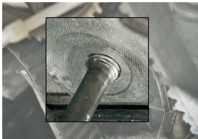
1. ábra: A tőcsavar nincs megfelelően becsavarva

Feltétlenül ügyeljenek arra, hogy a tőcsavar menete teljesen legyen becsavarva a motorblokkba! A tőcsavar nem megfelelő helyzete a feszítőgörgő hibás működéséhez vezethet!