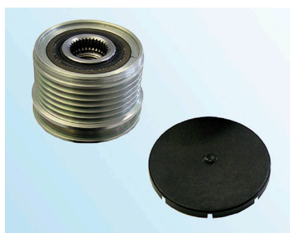
2. ábra: 535 0105 10

Az 535 0117 10 LuK-AS számú (1. ábra) rezgéscsillapító már nem szállítható és az 535 0105 10 cikkszámú termék helyettesíti (2. ábra).