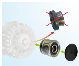
3. ábra: Termék helyettesítés