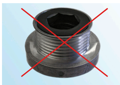
1. ábra: 535 0117 10

Az 535 0117 10 LuK-AS számú (1. ábra) rezgéscsillapító már nem szállítható és az 535 0105 10 cikkszámú termék helyettesíti (2. ábra).