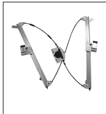
Nostro alzacristallo – our window regulator – notre lève-vitre – unser Fensterheber – nuestro elevalunas – nosso levantador de vidro - bizim cam acacagi - Γρύλος δικός μας