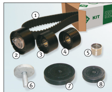
Bild 2: KIT-Inhalt 530 0342 10

Entsprechende Ersatzteile finden Sie in unserem Online-Katalog unter www.Schaeffler-Aftermarket.de oder im RepXpert unter www.RepXpert.com .