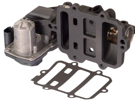
AGR-Ventil mit Dichtung (Art.-Nr. 7.04999.34.0)

Mögliche Ursachen für die Verrußungen finden Sie in unserer Service Information SI 0100.