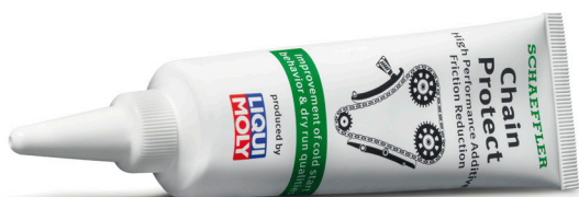
1. ábra: A Schaeffler Chain Protect-et speciálisan az új vezérműláncokhoz fejlesztették ki. Az adalék exkluzív módon kapható és kizárólag az INA vezérműlánc KIT-ben.

A javításkor a tubus teljes tartalmát fel kell használni. Az adalékot minden komponensre, tehát a vezérműláncra, az összes lánckerekekre, valamint a feszítő- és vezetőívekre fel kell hordani. Ez összekeveredik a motorolajjal és a következő olajcseréig a motorban marad.