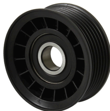
1. ábra: Vezetőgörgő tartó nélkül