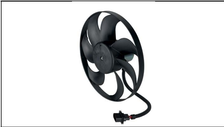
1 - Produkt / Product