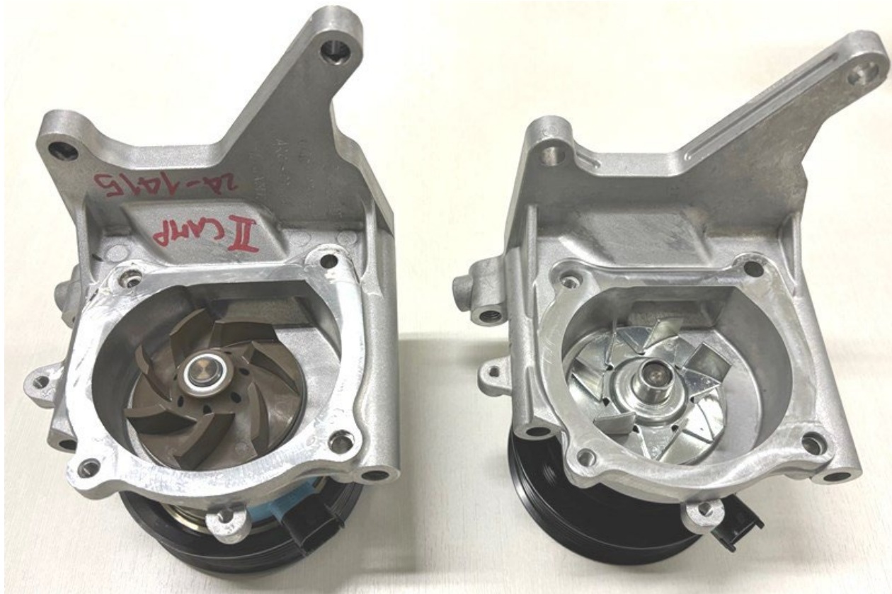
METELLI non azionabile/not switchable