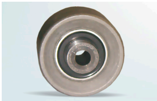
1. ábra: 532 0289 10 – fém kivitel