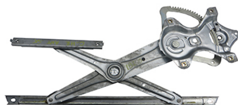
ORIGINAL POWER WINDOW LEFT ALZACRISTALLI ELETTRICO ORIGINALE SX