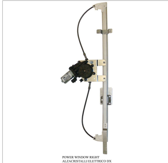
POWER WINDOW RIGHT ALZACRISTALLI ELETTRICO DX

THIS INSTALLATION INSTRUCTION IS FOR BOTH LEFT AND RIGHT SIDE. CETTE INSTRUCTION DE MONTAGE EST POUR LES DEUX COTES DROIT ET GAUCHE. DIESE MONTAGE-ANLEITUNG IST FÜR DIE BEIDE LINKE UND RECHTE SEITE. ESTA INSTRUCCION DE MONTAJE ES PARA LOS DOS LADOS IZQUIERDO Y DERECHO. ESTAS INSTRUÇÕES VALEM TANTO PARA O LADO ESQUERDO QUANTO PARA O DIREITO. DEZE AANWIJZINGEN GELDEN VOOR ZOWEL DE LINKER- ALS DE RECHTERKANT. Η ΠΑΡΟΥΣΑ ΟΔΗΓΙΑ ΑΦΟΡΑ ΤΟΣΟ ΤΗΝ ΑΡΙΣΤΕΡΗ ΟΣΟ ΚΑΙ ΤΗ ΔΕΞΙΑ ΠΛΕΥΡΑ. LA PRESENTE ISTRUZIONE VALE SIA PER IL LATO SINISTRO CHE PER IL LATO DESTRO.