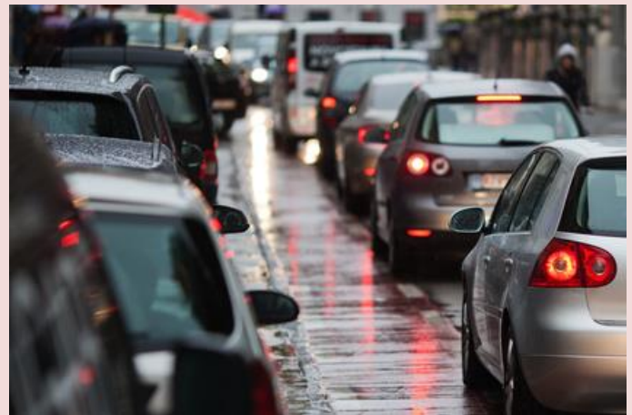
Bei Kurzstreckenfahrern sollte der Ölabscheider vor der Wintersaison unbedingt überprüft werden.

Friert dieses Gemisch im Winter ein, entstehen feste Öl-Wasser-Klumpen, die die Motor-Entlüftung blockieren können.