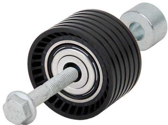
2. ábra: 532 0654 10 – Vezetőgörgő új tömítési rendszerrel és szerelvényekkel

Az aktuális hozzárendelést lásd az alkatrészatalógusban.