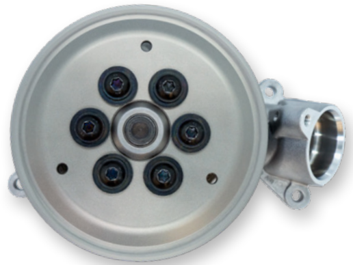
Komplettkit 7.10942.58.0 – fertig montierte Wasserpumpe mit Riemenscheibe und Schrauben

Seit Januar 2025 ist die Wasserpumpe OE-Nr. 06M 121 013 D seitens OE nicht mehr erhältlich. Sie wurde durch die OE-Nr. 06M 121 013 G ersetzt. Da die neue Wasserpumpe 06M 121 013 G eine andere Nabe aufweist (sechs statt vier Löcher), müssen beim Austausch nicht nur die variable Wasserpumpe, sondern auch die Riemenscheibe und die Schrauben ausgetauscht werden.