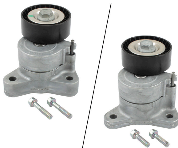
1. ábra: 534 0325 10 cikkszámú feszítőkar - balra, régi kivitel rögzítőcsavarokkal. Jobbra, új kivitel rögzítőcsavarokkal

Termékeink állandó továbbfejlesztése alapján az 534 0325 10 cikkszámú feszítőkart módosítottuk.