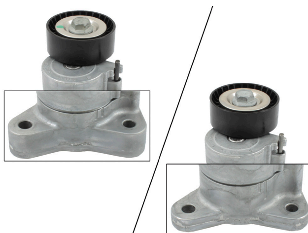
3. ábra: Balra, régi kivitel széles rögzítési pontokkal. Jobbra, új kivitel keskeny rögzítési pontokkal.

Ügyeljenek a jármű gyártójának előírásaira!