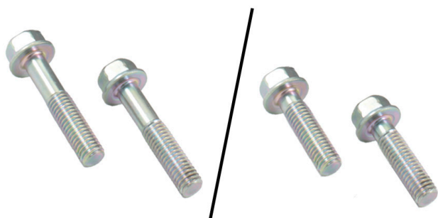
4. ábra: Balra, régi M8x40 mm méretű csavarok. Jobbra, új M8x30 mm méretű csavarok.

A módosított feszítőkar beszerelésekor feltétlenül a mellékelt csavarokat kell alkalmazni.