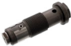
SWAG 10 94 0152