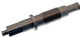
Mérőskálás láncfeszítő SWAG 10 94 0125

Csörgő hangot hallani a hideg motor beindítása után a M271-es motorok (EVO) esetén. Ezt okozhatja a lánckopás, lánckerekek, vagy a vezérműlánc nyúlása. Ez vezethet a helytelen járáshoz és a legrosszabb esetben a motor meghibásodásához.