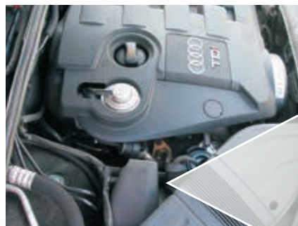
Ábra: VTG-töltő és EPW (pirosra színezve) az Audi A4 TDI modellben