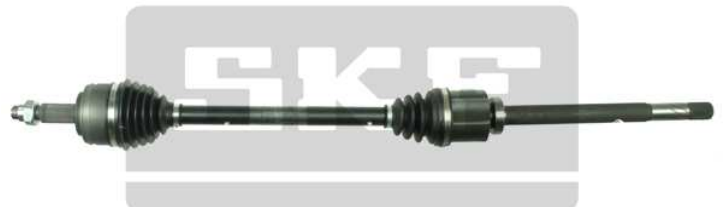
Új SKF kialakítás