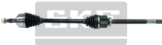
Korábbi SKF kialakítás

Az előző SKF kialakítás egyaránt garantálja a pontos illesztést és minőséget.