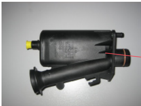
KARAFKA NA OLEJ