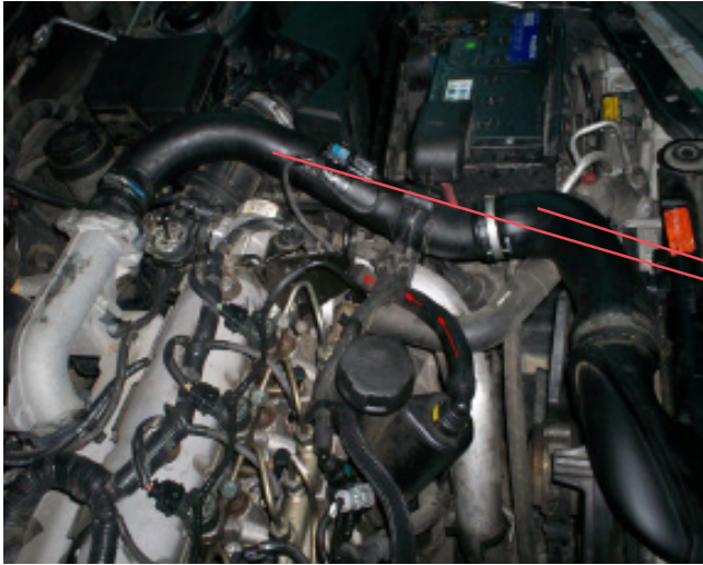
CONDUCTO DE ADMISIÓN

Recordarles a su vez, de realizar los intervalos de servicio, y la calidad del lubricante, especificada por el fabricante.