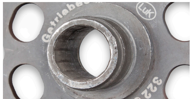
2. ábra: Sérült agyprofil

Ha a kuplung vagy a DMF cseréjekor új rögzítőcsavarokat mellékeltek, akkor azokat kell használni. Ha nincsenek mellékelve csavarok, akkor kizárólag M6x13 méretű 10.9 szilárdsági osztályú csavarokat szabad használni.